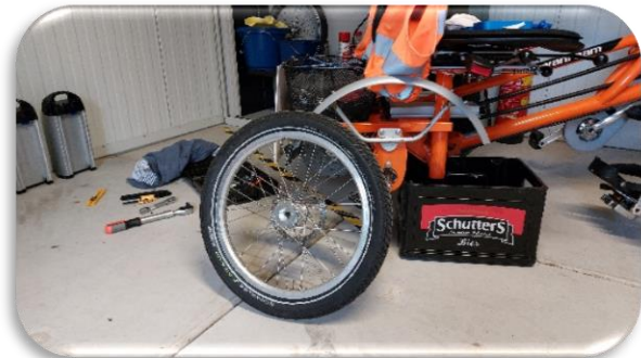
Nieuwe velg plus band monteren

Om het verhaal plezierig leesbaar te houden, gaan we inhoudelijk maar niet in op technisch geneuzel, want het moet wel leuk blijven, dus laten we de techneuten aan u voorstellen: